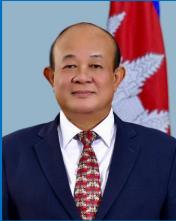
ឯកឧត្តម ស៊ីម ស៊ីថា រដ្ឋលេខាធិការ ក្រសួងឧស្សាហកម្ម វិទ្យាសាស្ត្រ បច្ចេកវិទ្យា និងនវានុវត្តន៍ ប្រធានក្រុមប្រឹក្សាភិបាល