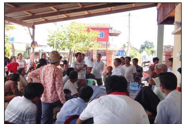
លើកទី ៣ : ថ្ងៃទី ៣០ ខែ ធ្នូ ឆ្នាំ ២០១៥ វេលាម៉ោង ៨ : ៣០នាទី ភូមិត្រពាំងធ្មង សង្កាត់ព្រែកប្រា ខណ្ឌច្បារអំពៅ ក្រុងភ្នំពេញ។ ប្រជាពលរដ្ឋចូលរួមចំនួន ៦០នាក់។