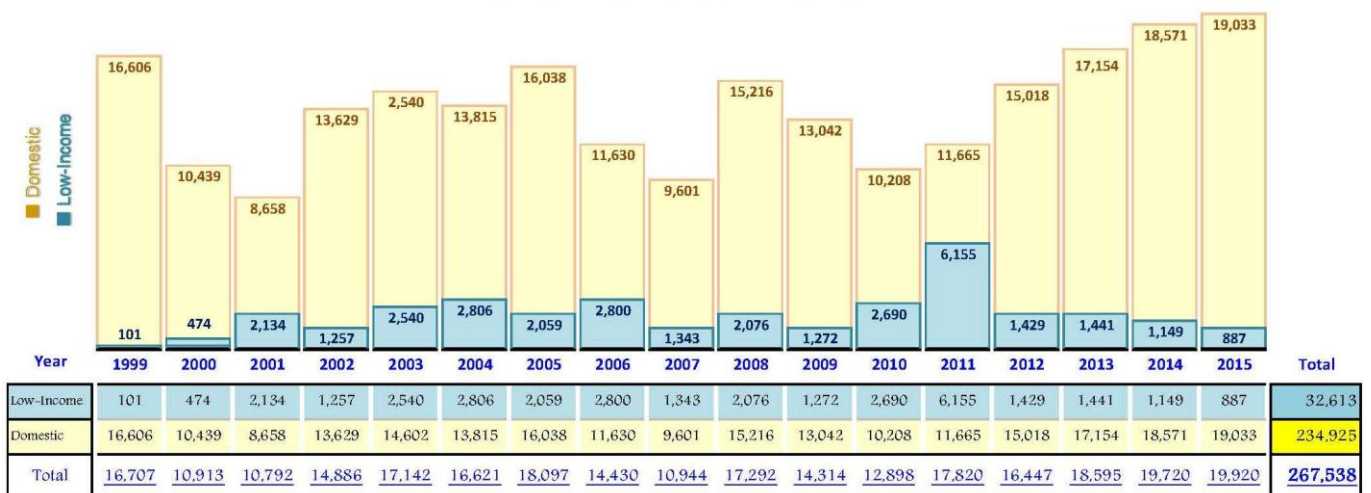
Connections of Low-Income customer by each year

From 1999 till the end of 2015, PPWSA has provided a total of 32,613 connections or 11.2% of total (290,732) connections installed which subsidy worth 5,535,333,360 Riel, equivalent to USD 1,383,833. (Annex 1)