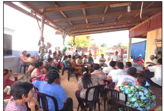
លើកទី ២ : ថ្ងៃទី ២១ ខែ សីហា ឆ្នាំ ២០១៥ វេលាម៉ោង ៩ : ៣០នាទី។ ផ្លូវ 4AD ភូមិស្រែរាជ សង្កាត់ព្រែកប្រា ខណ្ឌច្បារអំពៅ ក្រុងភ្នំពេញ។ ប្រជាពលរដ្ឋចូលរួមចំនួន ១០០នាក់។