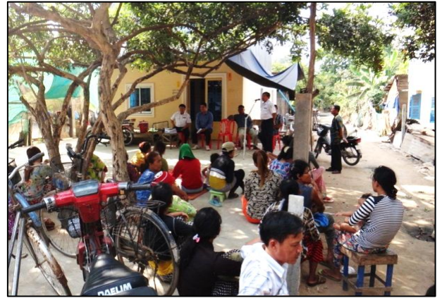
លើកទី ១ : ថ្ងៃទី ២៥ ខែ មីនា ឆ្នាំ ២០១៥ វេលាម៉ោង ១៤ : ៣០នាទី (សហគមន៍ចំរើនអភិវឌ្ឍន៍) ផ្លូវ ៣៦៩ និង ៧៨០ ភូមិអណ្តូង សង្កាត់ព្រែកប្រា ខណ្ឌច្បារអំពៅ ក្រុងភ្នំពេញ។ ប្រជាពលរដ្ឋចូលរួម ចំនួន ៧០នាក់។