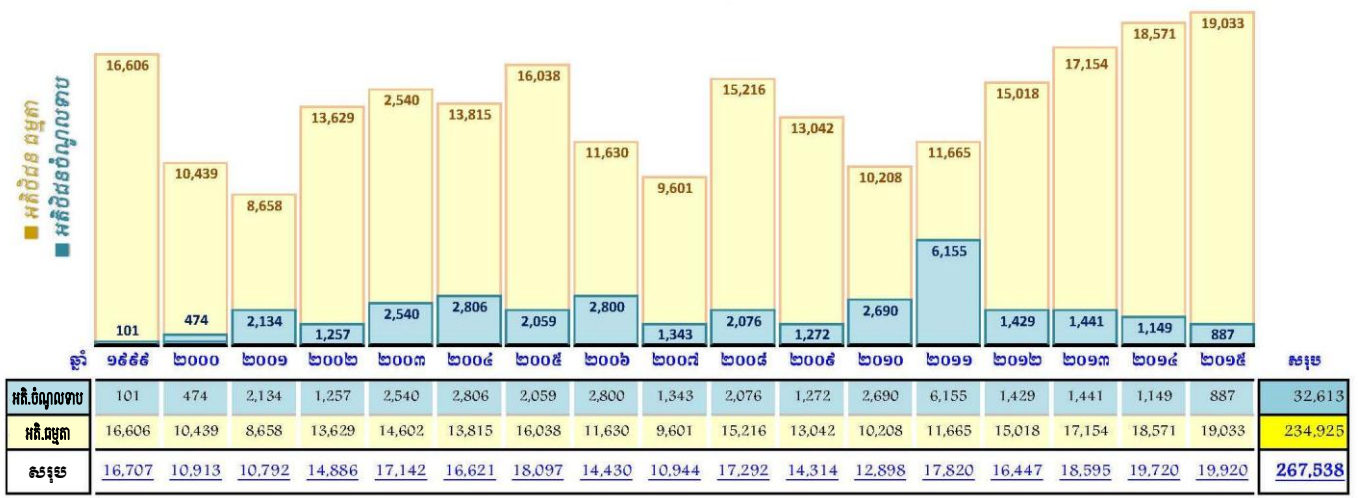
ចំនួនបណ្តាញអតិថិជនចំណូលទាបក្នុងបណ្តាញឆ្នាំនីមួយៗ

បើគិតចាប់ពីឆ្នាំ១៩៩៩ ដល់ ឆ្នាំ២០១៥ រដ្ឋាករទឹកស្វយ័តក្រុងភ្នំពេញបានតបណ្តាញជូនអតិថិជនចំណូលទាប បានសរុបចំនួន ៣២,៦១៣ បណ្តាញ ស្មើនឹង ១១.២% នៃចំនួនបណ្តាញសរុប (២៩០,៧៣២ បណ្តាញ) ដែលបាន ចំណាយទឹកប្រាក់សរុបចំនួន ៥,៥៣៥,៣៣៣,៣៦០ រៀល ត្រូវជា ១,៣៨៣,៨៣៣ ដុល្លារ (ឧបសម្ព័ន្ធ ១) ។